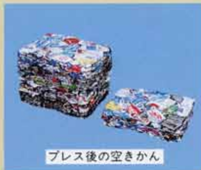
プレス後の空きかん