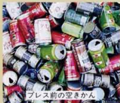
プレス前の空きかん