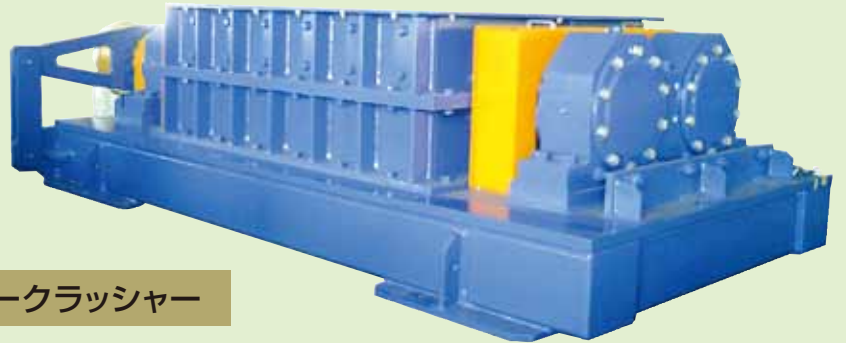
マイティークラッシャー