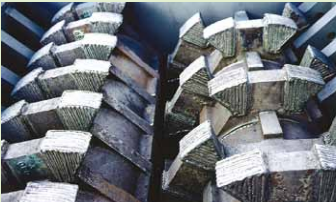
ウルトラクラッシャー